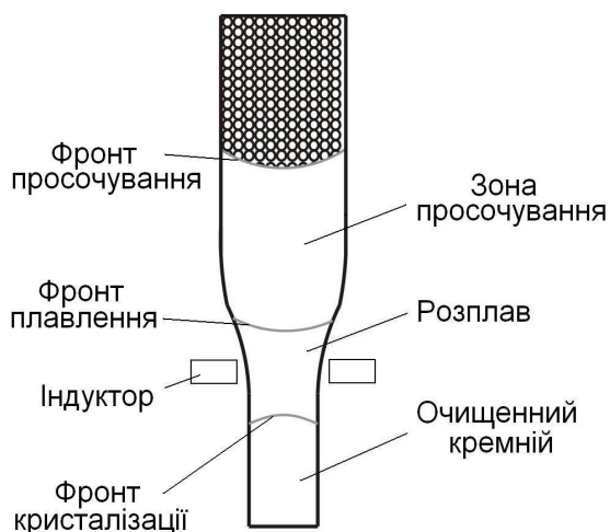
Рис. 1. Схема просочування розплавом пористої заготовки кремнію.