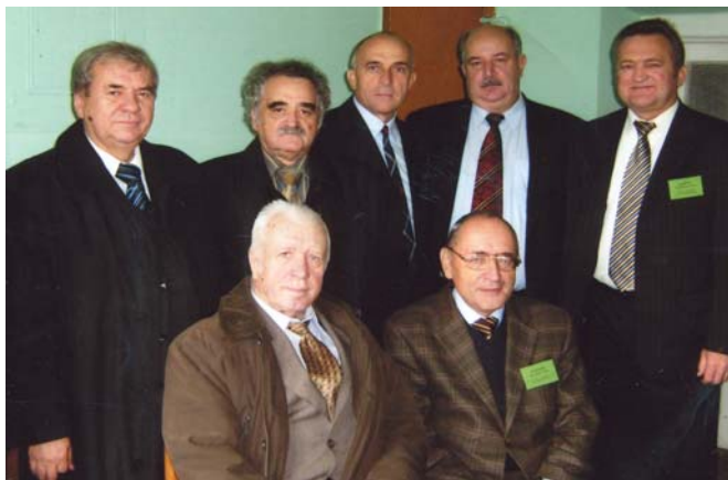
Учасники VI міжнародної школи-конференції «Актуальні проблеми фізики напівпровідників», 2008 р.

конструювання і методики використання; 3) Вплив зовнішніх чинників на фізичні параметри кремнію та модифікованих напівпровідникових матеріалів.