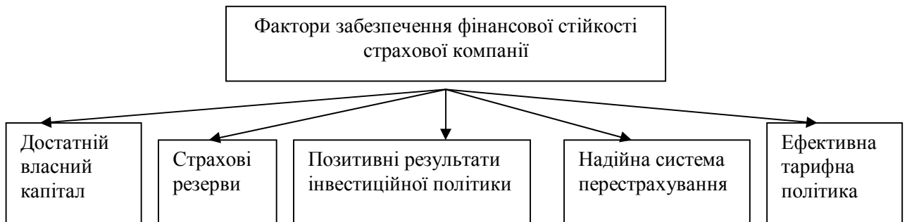
Рис. 1. Фактори забезпечення фінансової стійкості страховика

Результати. Проведені дослідження свідчать, що під фінансовою стійкістю страхових операцій розуміють постійну збалансованість або перевищення доходів над витратами страховика в цілому по страховому фонду [1]. Фактори, що забезпечують фінансову стійкість страхової компанії, подані на рис. 1.