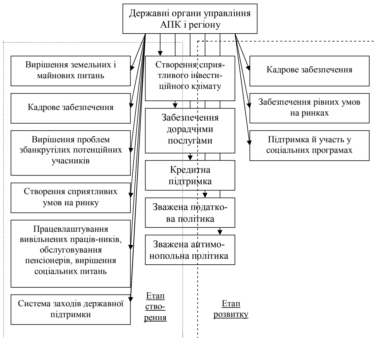
Рис. 1. Схема державного впливу на інтеграційні процеси в регіоні

Соціальна відповідальність, особливо великих інтегрованих підприємств, передбачає активну участь таких структур у соціально-економічному розвитку регіонів, але не означає перебирання ними головних функцій владних органів. Крім того, для підприємств і організацій неаграрних сфер АПК та інших галузей, стратегія розвитку яких передбачає диверсифікацію бізнесу (на відміну від переробних підприємств, що формують сталу зону обслуговування), при виборі партнерів нерідко основним стає рівень розвитку виробничої та соціальної інфраструктури.